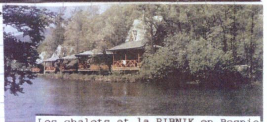
Les chalets et la RIBNIK en Bosnie